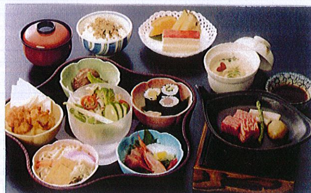
お子様の夕食イメージ