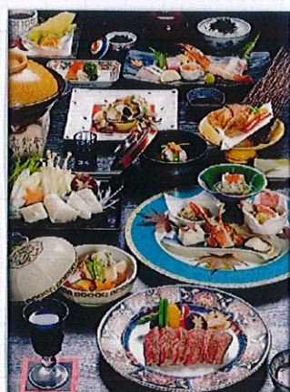
雪月花 ~せつげいか~ 10,000円(税別)