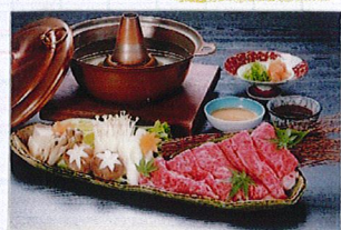
但馬ビーフしゃぶしゃぶ鍋 3,500円