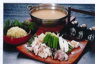
但馬ビーフもつ鍋 3,000円