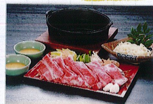
但馬ビーフすき焼き鍋 3,500円