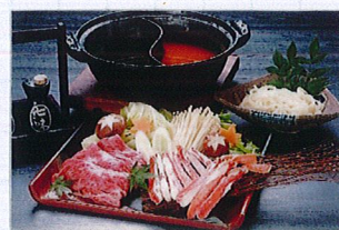
しゃぶしゃぶ2色鍋 3,000円