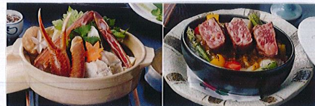
ご夕食は 蟹と河豚の鍋 や 但馬ビーフ と野菜の 柚子味噌田楽焼き などをお楽しみ頂ける 厳選会席 をご用意致します。