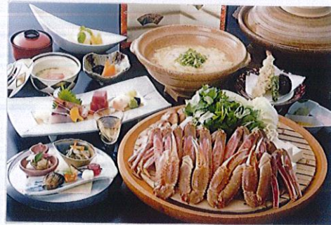
ご夕食は かにすき会席

① ガーデンラウンジ「フロラ」の フリーパス券 サービス ※ご利用時間 7:30～18:00